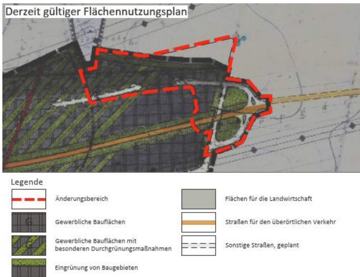
Abbildung 1: Auszug aus dem Flächennutzungsplan der Stadt Schwabmünchen: Darstellung des Änderungsbereiches im Bestand

In dem rechtsgültigen Flächennutzungsplan der Stadt Schwabmünchen werden für den Änderungsbereich zu größten Teilen bereits gewerbliche Bauflächen dargestellt. Der westliche Teilbereich wird als gewerbliche Bauflächen mit besonderen Durchgrünungsmaßnahmen dargestellt. Zudem ist an den Randbereichen eine Eingrünung dargestellt. Weiterhin ist bereits die Weiterführung der „Gottlieb-Daimler-Straße“ dargestellt, welche in einer Spange in die Kreisstrasse (Darstellung als sonstige Straßen mit Grünflächen) einmündet. Der nordöstliche Teil des Änderungsbereichs wird als Fläche für die Landwirtschaft dargestellt.